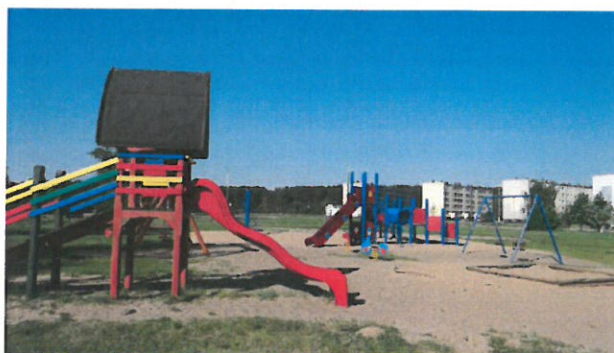
Teren placu zabaw po wykonaniu inwestycji