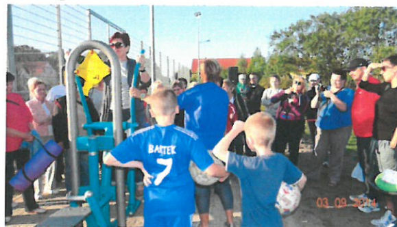
Wzorcowy pokaz ćwiczeń na urządzeniach fitness