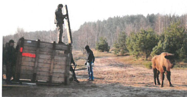
Na zdjęciu – wpuszczenie do zagrody młodych żubrów

Jest to przedsięwzięcie o całkowitej wartości 1 100 000 złotych, z czego 825 000 sfinansowało RPOWZ, a 130 000 WFOŚiGW w Szczecinie. Celem projektu było utworzenie zagrody zamkniętej dla żubrów z kompletnym zapleczem do jej obsługi w Jabłonowie, w gminie Mirosławiec. W dniu 28 marca 2014 r. z Gołuchowa, do zagrody przyjechała pierwsza grupa żubrów – tj. cztery żuberki o imionach: Popłoch, Polasek, Polesia i Polonka.