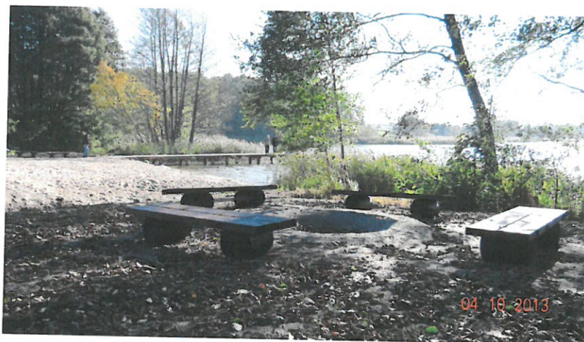
Widok plaży w Łowiczu Waleckim po realizacji robót budowlanych

Całkowity koszt projektu wyniósł : 240 054,97 zł.