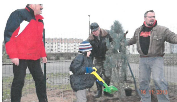
Na zdjęciu - mieszkańcy Mirosławca Górnego podczas sadzenia drzew i krzewów