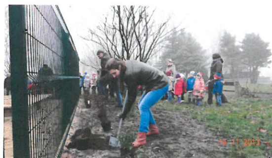
Plac zabaw w parku po realizacji robót budowlanych - podczas sadzenia krzewów ozdobnych