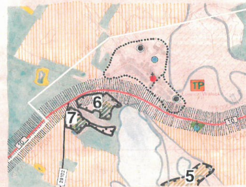
LOWICZ WAŁECKI 1:10 000