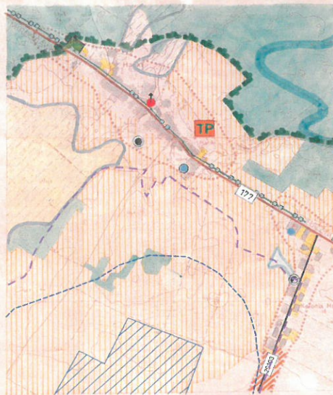
HANKI 1:10 000