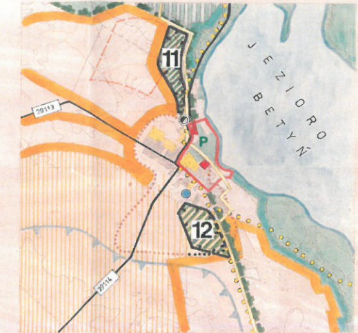
PROCHNOWO 1:10 000