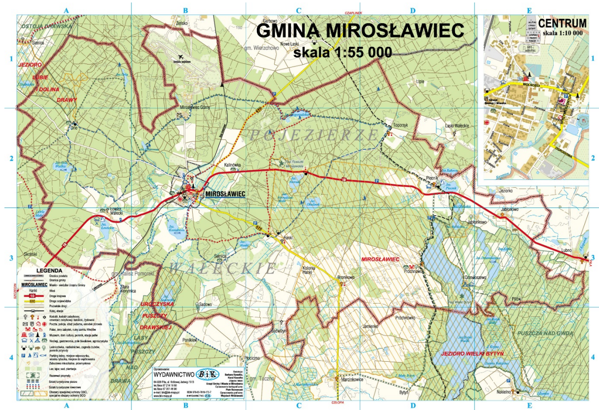
Mapa fizyczna gminy Mirosławiec

Pod względem powierzchni gmina Mirosławiec zajmuje 203 km kw. i jest zamieszkała przez ok. 5700 mieszkańców.