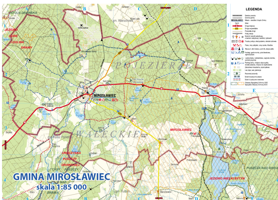
Mapa z zaznaczonymi obszarami Natura 2000

Puszcza nad Gwdą (PLB 300012) – ostoja o powierzchni 77 678,9 ha, z czego w Gminie 1 890 ha. Położona jest w większości na Pojezierzu Wałęckim, Równinie Wałęckiej i Dolinie Gwdy. Obszar ostoi to rozległy kompleks leśny o urozmaiconej rzeźbie terenu. Wokół jezior utrzymują się rozległe torfowiska. Swoje źródła ma tu również kilka rzek.